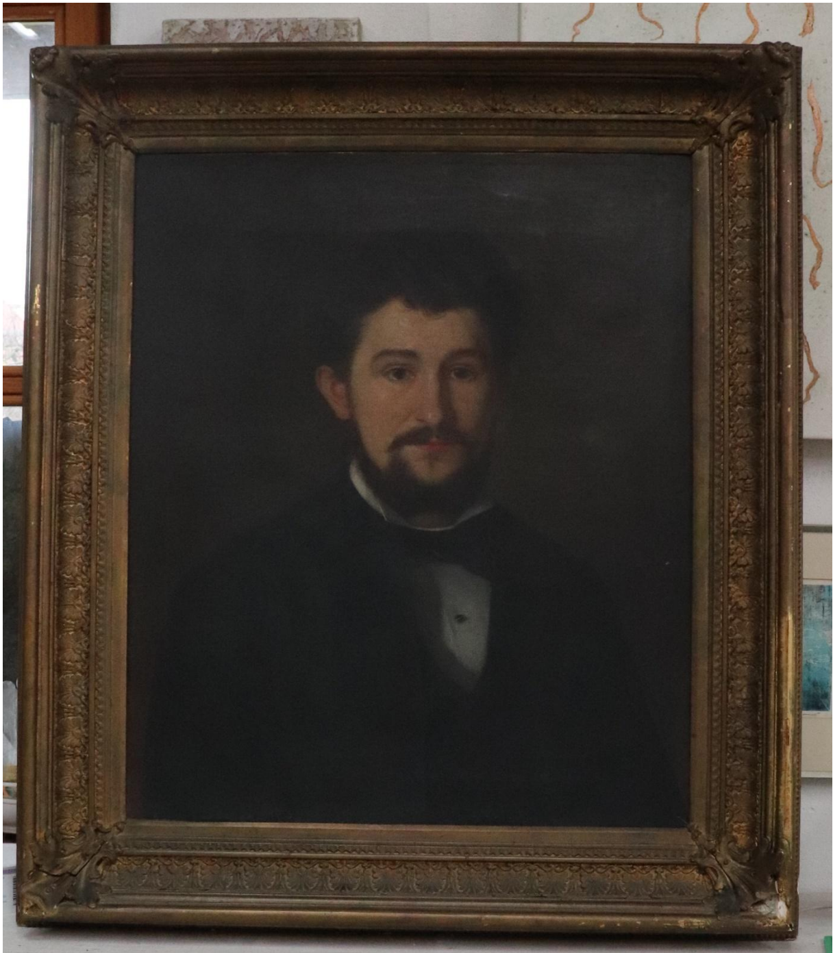
Stav obrazu před započítím restaurátorských prací. Zjevné je celkové ztmavnuté obrazu i zlaceného rámu.