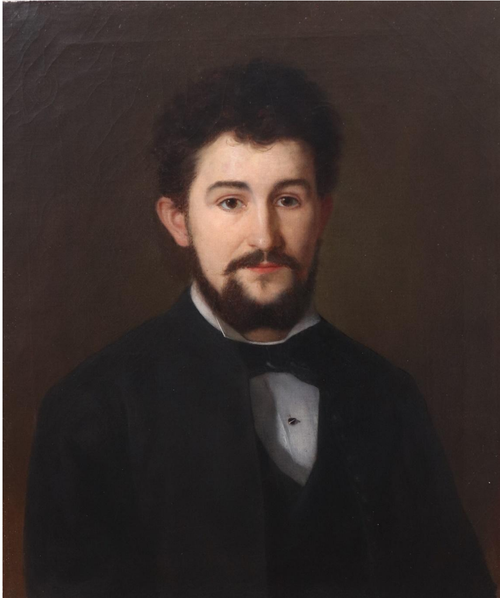
Stav obrazu po dokončení restaurátorských prací včetně vyrovnání a stabilizace plátna.