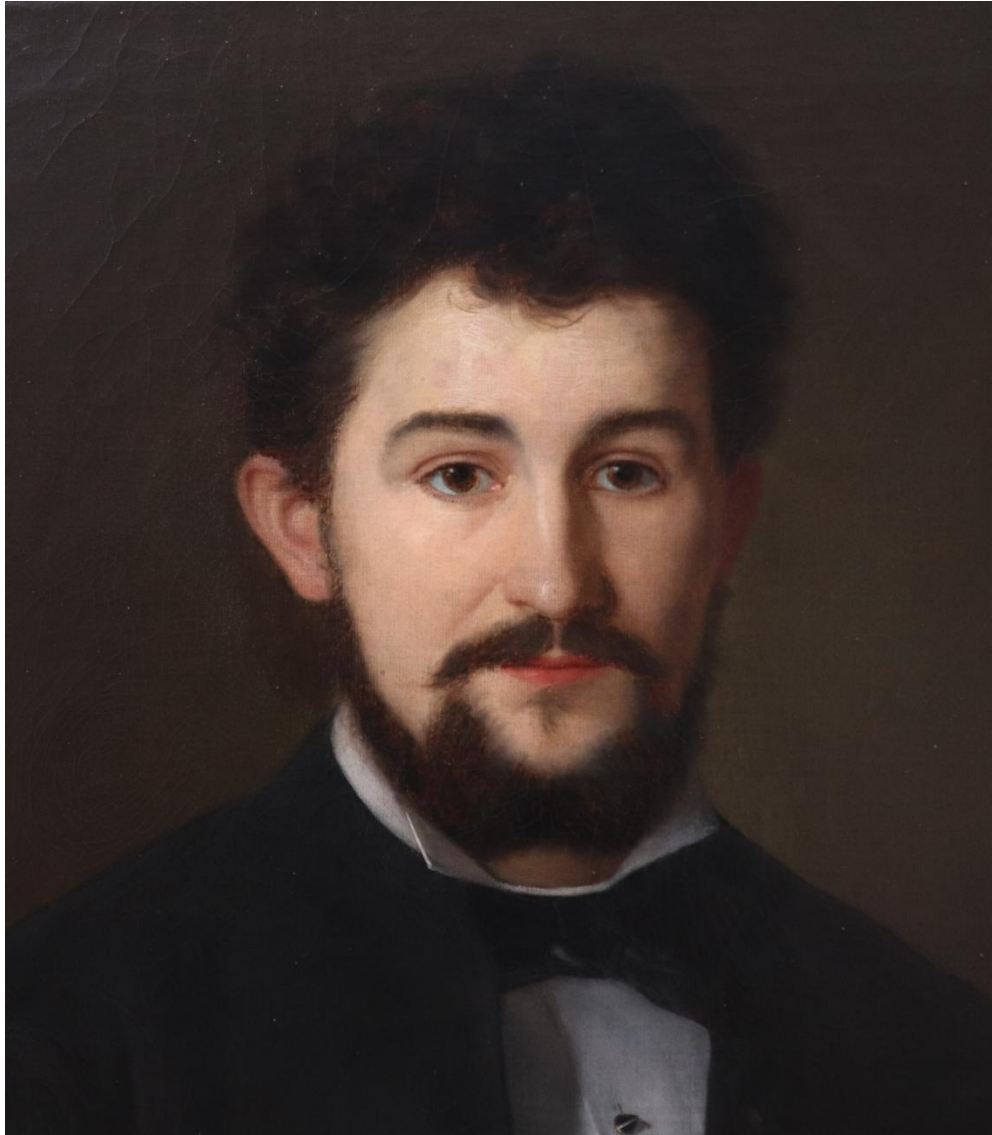
Stav obrazu po vyčištění a retuších. Detail obrazu.