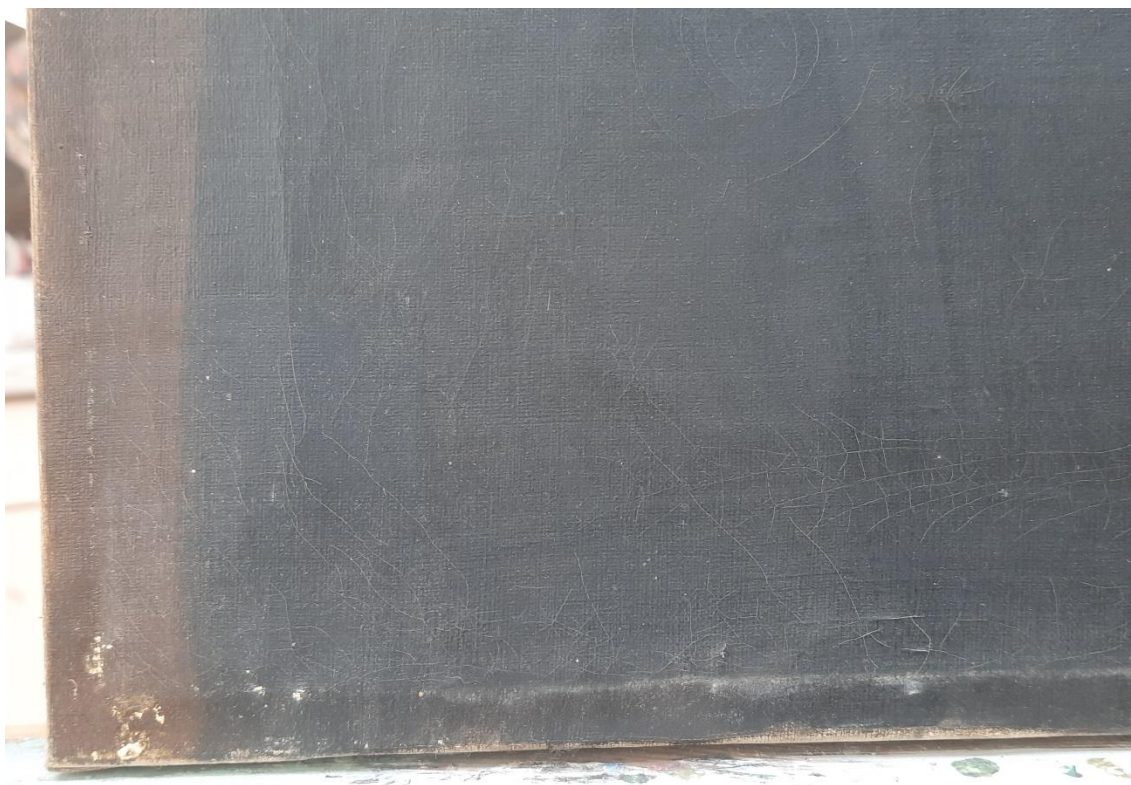
Levý spodní okraj obrazu, stav před restaurováním. Patrná je drobná krakeláž a mírné odřeniny malby.