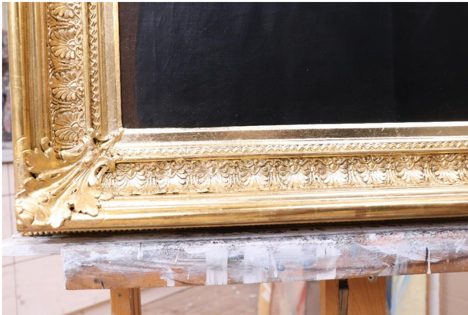
Stav rámu po dokončení obnovy zlacených povrchů na plastickém dekoru na lesk i mat.