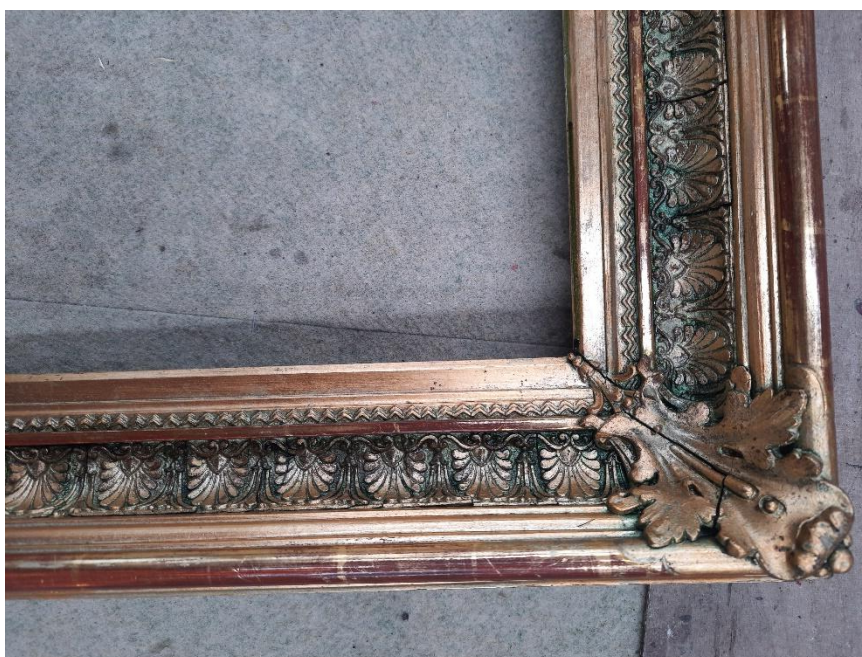
Stav rámu po snímání přemalob. Podařilo se odkrýt zlacení na polyment se zbytky pravého zlacení na lesk zaleštěné achátovým kamenem.