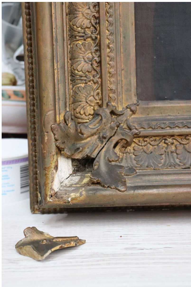
Stav poškození, odpadlý úlomek levé části rámu,