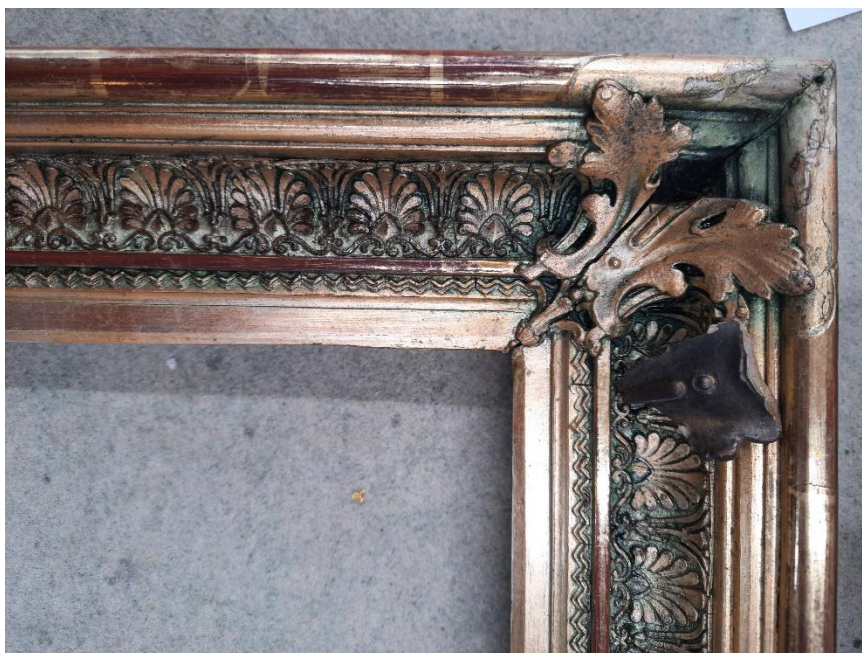
Stav rámu po snímání přemalob. Podařilo se odkrýt zlacení na polyment se zbytky pravého zlacení na lesk zaleštěné achátovým kamenem.