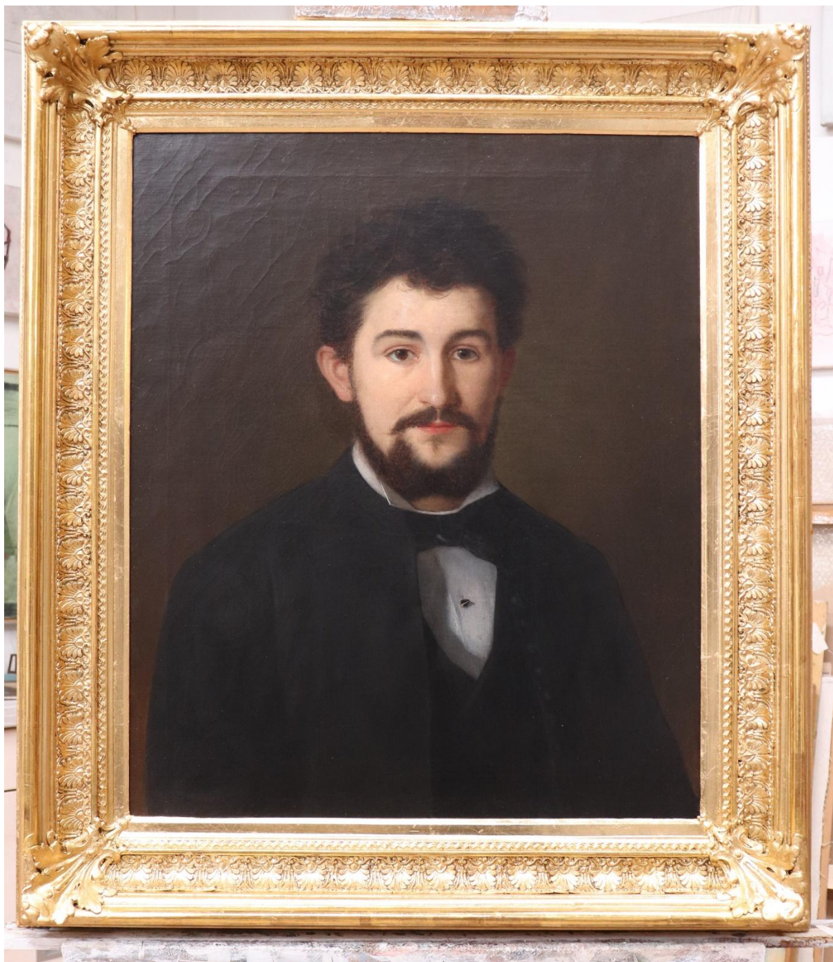
Stav díla po dokončení restaurátorských prací. Stabilizace plátna, vyčištění, tmelení a retuších, vyzlacení rámu.