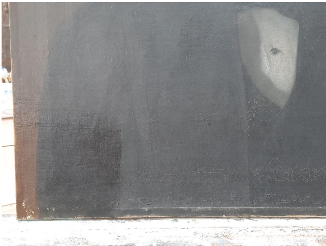
Snímání povrchově usazených nečistot a pokostového laku. Tmavé barvy jsou tak zvýrazněny.