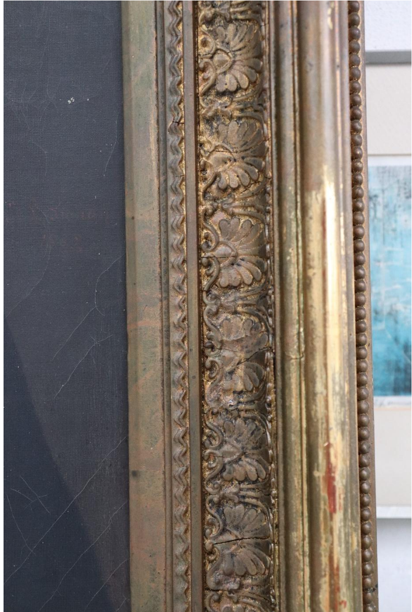
Zkouška snímání druhotných vrstev, chemicky dimetyl amid kyseliny mravenčí a xylen.