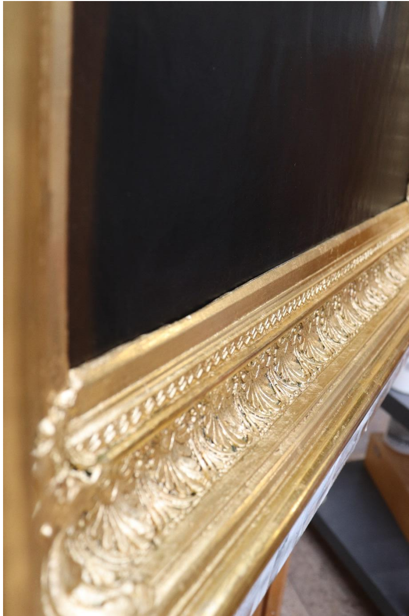
Stav rámu po dokončení obnovy zlacených povrchů na plastickém dekoru.