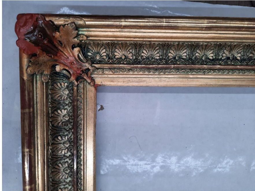
Stav rámu po odstranění přemaleb a zajištění uvolněné modelace. Doplnění chybějících prvků plastické výzdoby zdobného rámu.