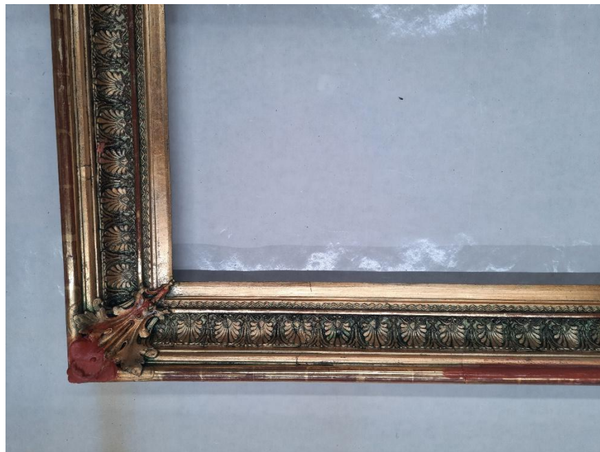
Stav rámu po odstranění přemaleb a zajištění uvolněné modelace. Doplnění chybějících prvků plastické výzdoby zdobného rámu.