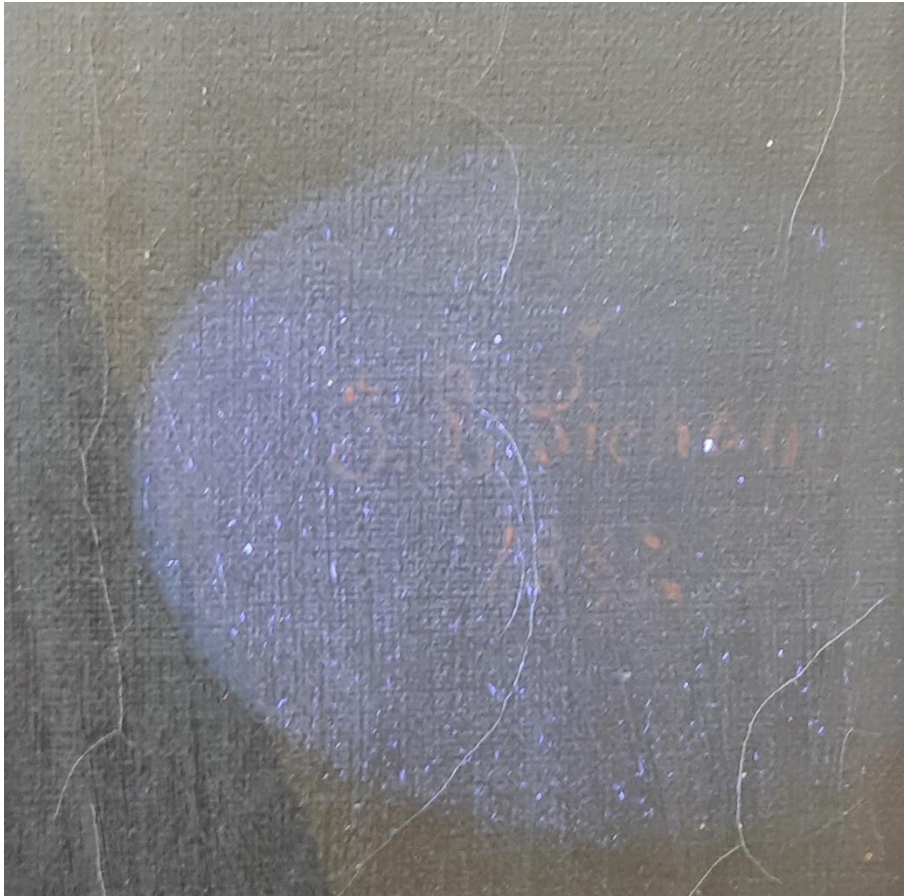
Signatura na pravé straně obrazu uprostřed J.L. Šichan a vročení díla do roku 1882.