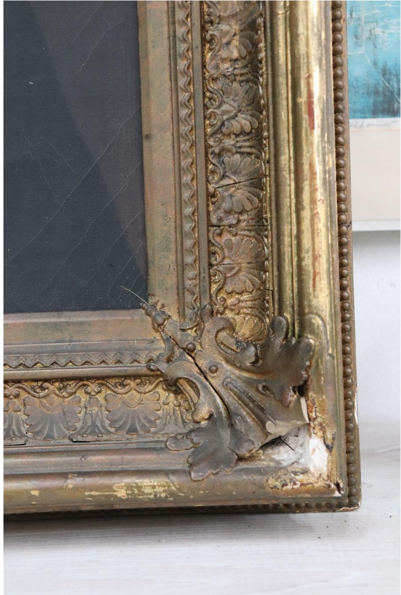
Pravý spodní roh rámu, chybějící modelace. provedeny zkoušky snímání ztmavých nátěrů.