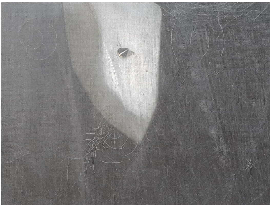
Stav po vyčištění odhalil množství drobných trhlin v ploše obrazu. Barevnost originálu byla navržena.