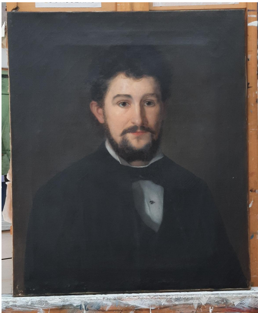
Stav obrazu po vyčištění, barevnost malby je zvýrazněná zvláště po odstranění laků.