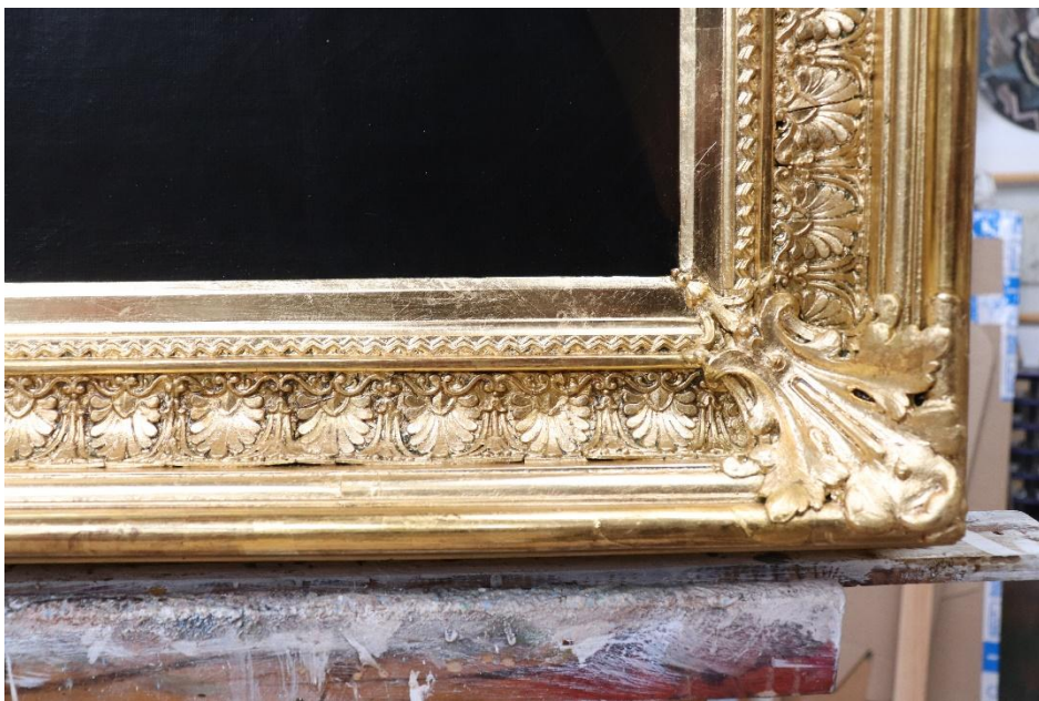
Stav rámu po dokončení obnovy zlacených povrchů na plastickém dekoru na lesk i mat.