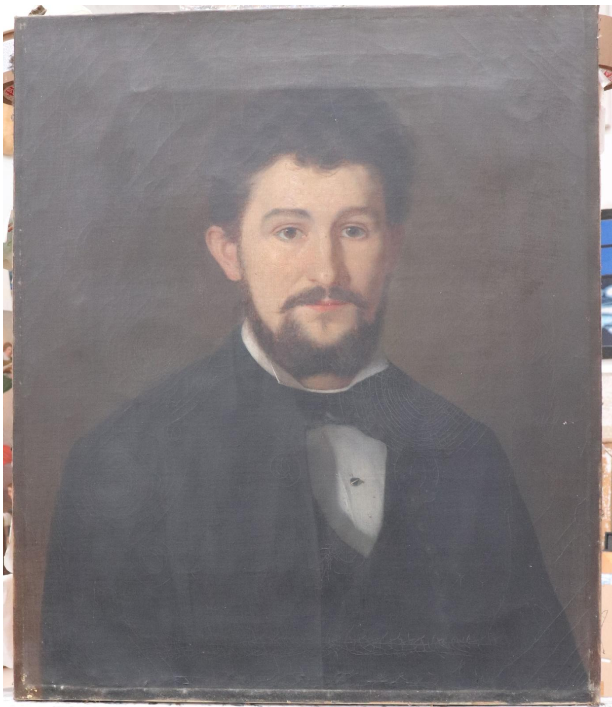
Obraz po vyjmutí ze zdobného rámu. Zjevný je nevhodný reliéf pro rýsovaného napínacího rámu.